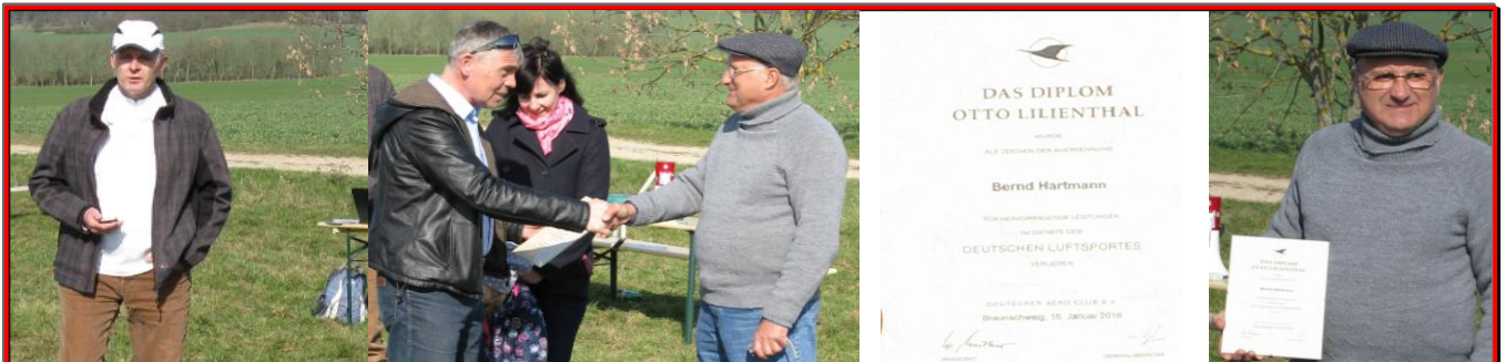
Impressionen vom 3. Leuchtenburgpokal am 9.4.16 in Kessler/ Thüringen